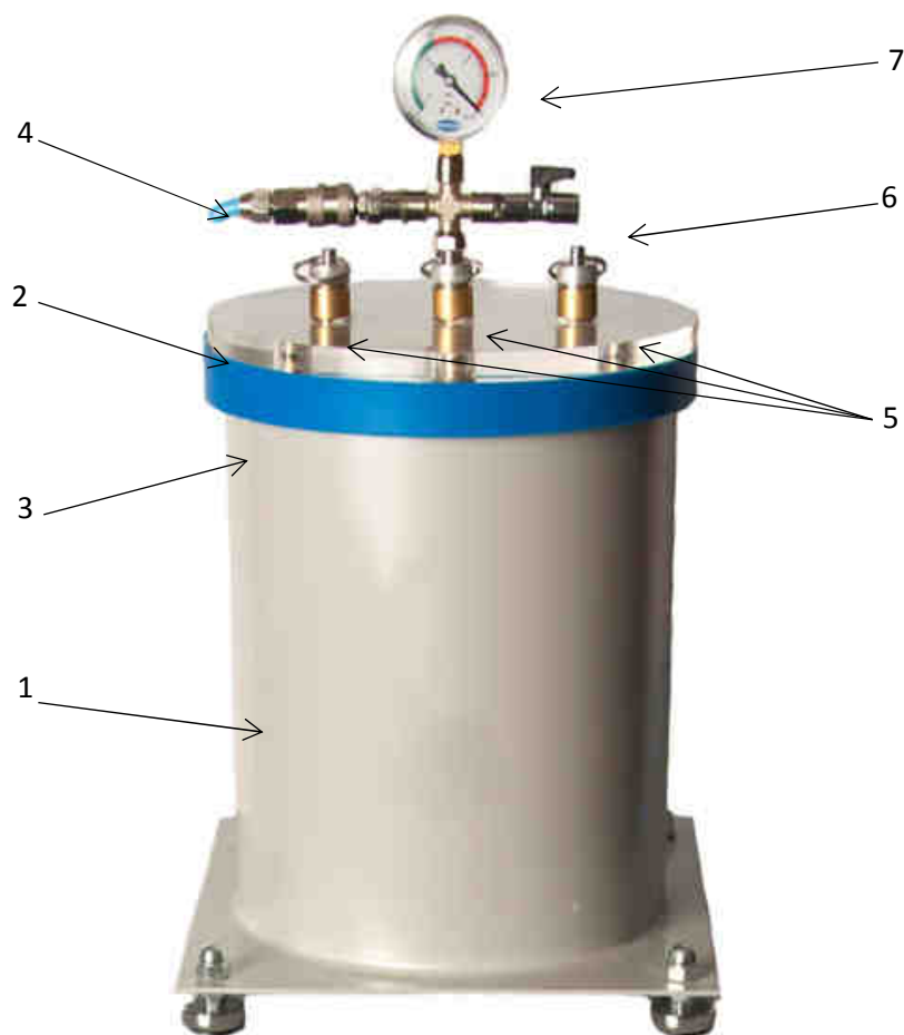
Рисунок 1 – Вакуумная ловушка/дегазатор: 1 – бак дегазатора; 2 – крышка; 3 – уплотнитель; 4 – быстросъемное соединение для подключения вакуумного насоса; 5 – вакуумные порты; 6 – клапан натекателя; 7 – вакуумметр

Основные элементы конструкции данного блока показаны на рисунке 1.